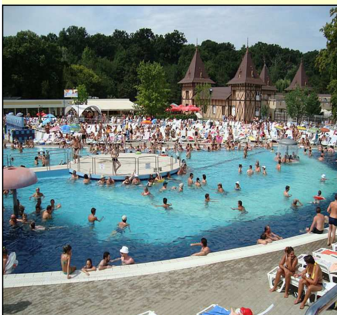
Bildet er fra Baile Felix og ikke selve hotellet vi skal bo på.

Se mer inne i bladet. Påmeldingslipp side 7. Meld deg på straks.