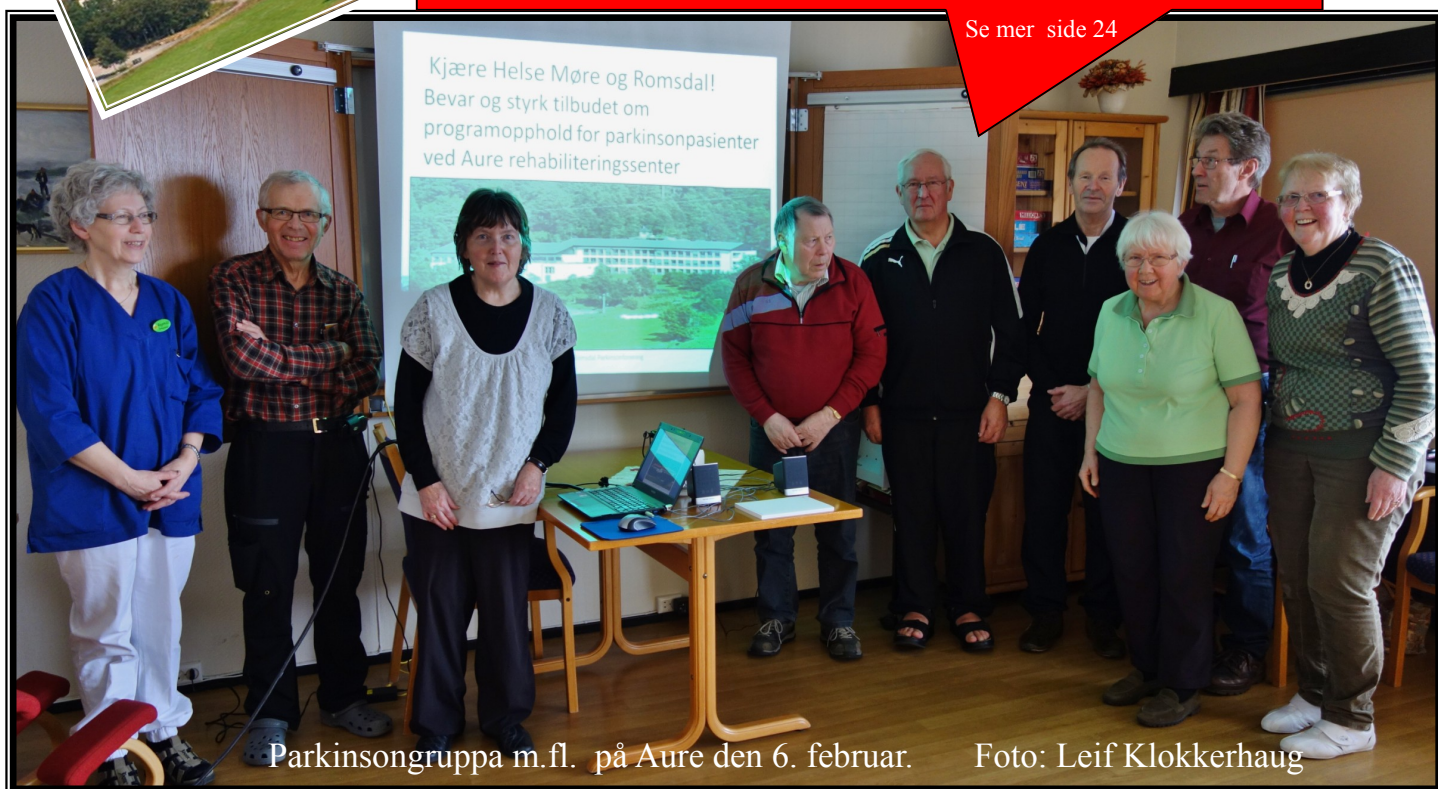
Parkinsongruppa m.fl. på Aure den 6. februar.