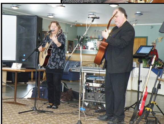
Dansegruppa Blåsko fra Molde underholdt med fengende musikk i westernstil.