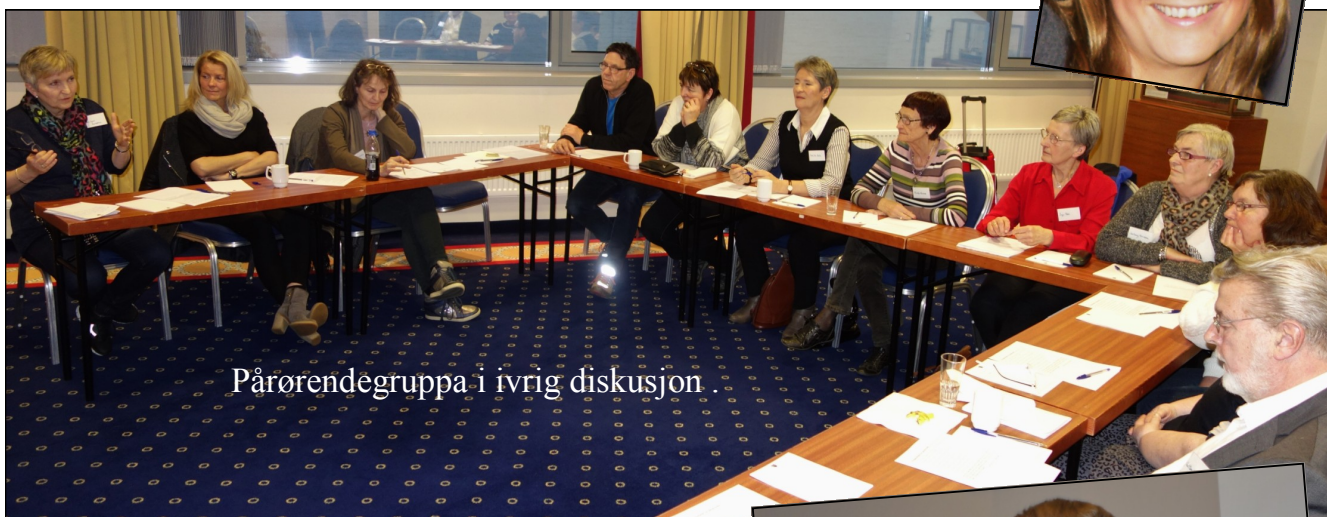
Pårørendegruppa i ivrig diskusjon.

Samlingen denne gang var spesielt siktet mot de pårørende sin situasjon og deres rettigheter. For en del av samlinga var deltakerne derfor delt inn i to grupper, en for pårørende og en for pasienter.