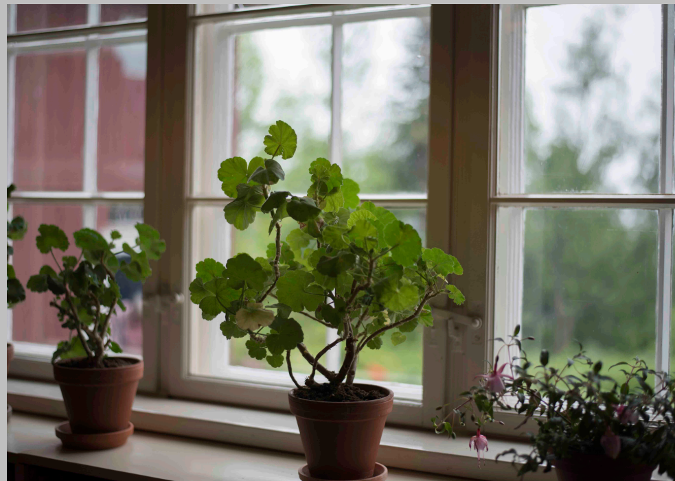
August 2019