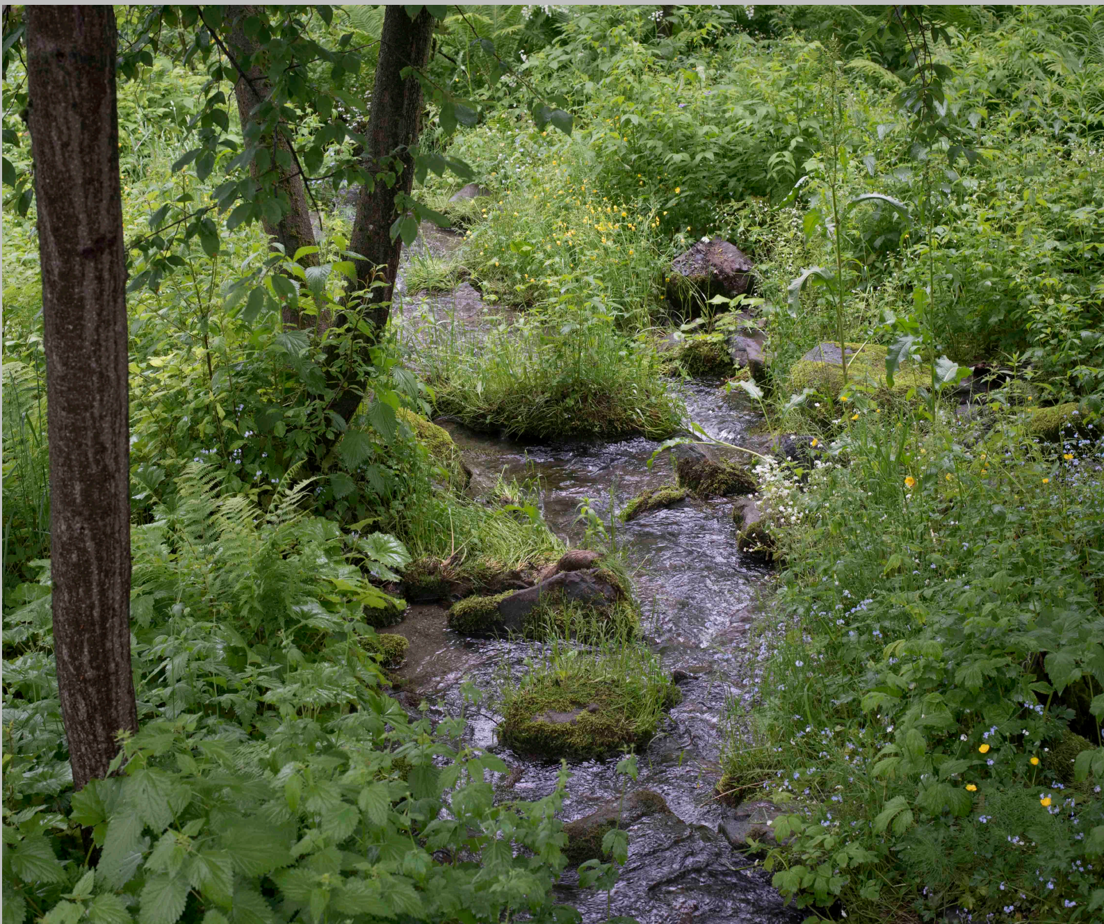
BEKKEN GJENNOM BJERKEBÆK