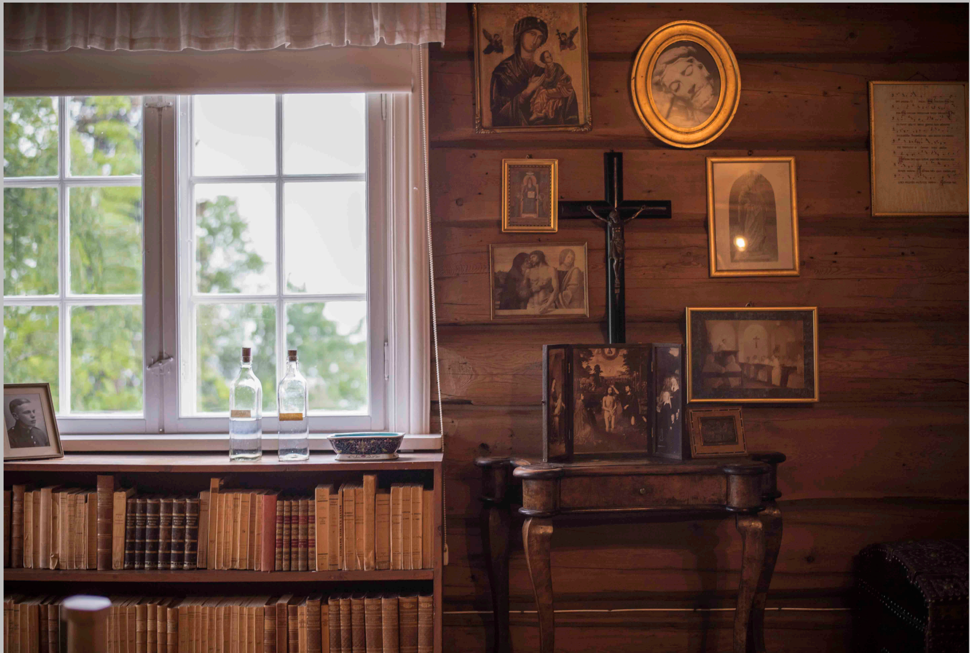
FRA STUEN I ANDRE ETASJE – MED STED FOR STILLE STUND. SIGRID UNDSET VAR KATOLIKK.