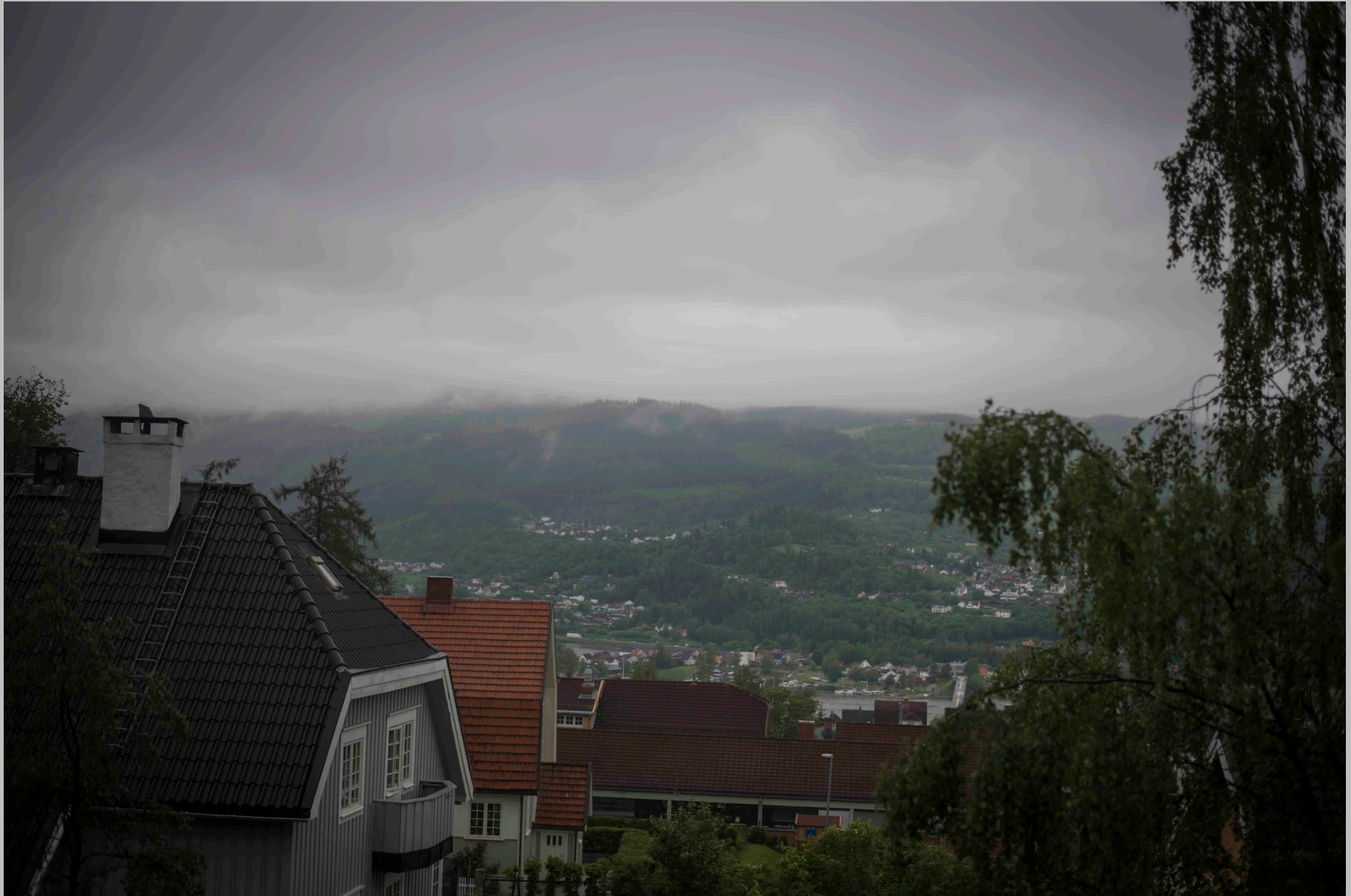
NEDOVER BAKKENE I LILLEHAMMER