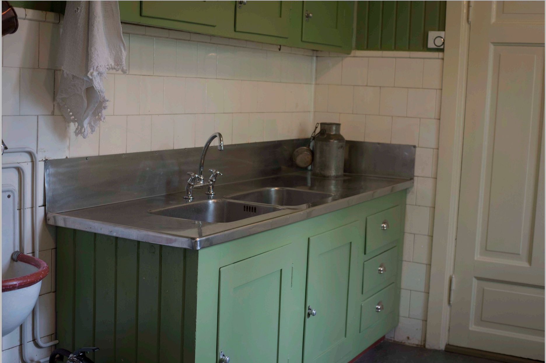
ET MODERNE, FUNKSJONELT KJØKKEN