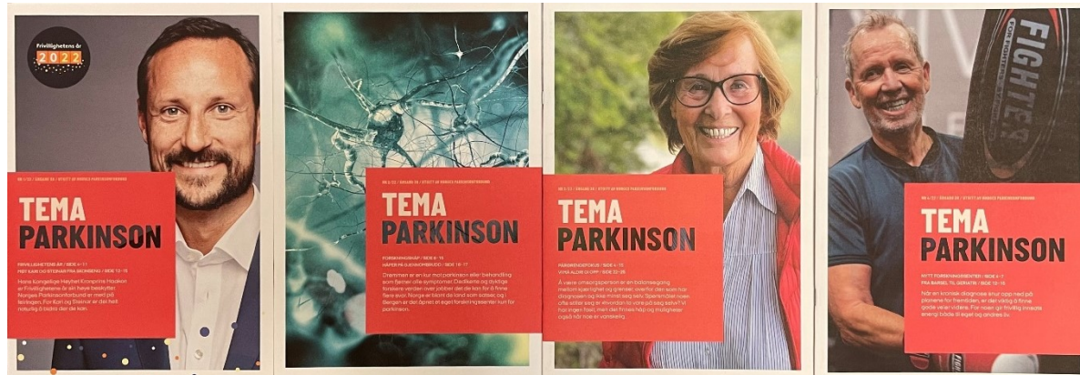
Forsiden på de fire utgavene av medlemsbladet Tema parkinson i 2022.

Link: Medlemsblad - Norges Parkinsonforbund