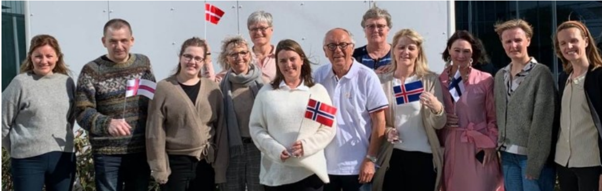
Nordisk Parkinsonråd samlet i Stavanger i mai 2022.