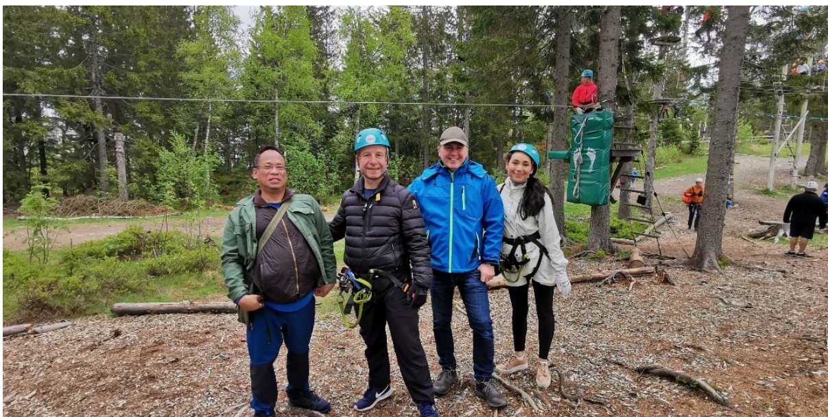
Deltakere og ansatte i Norges Parkinsonforbund i klatreparken i forbindelse med samling for yngre personer med parkinson, mai 2022.