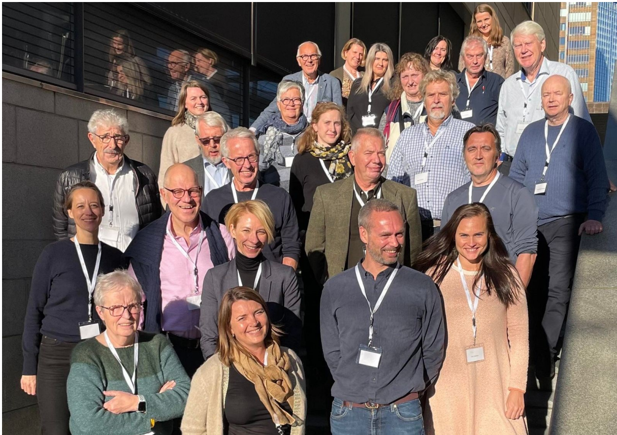
Bilde fra samling for brukermedvirkere i ParkinsonNet 19. oktober 2022.