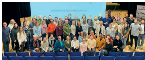
Fra ParkinsonNet-kurset på Nodeland i fjor.

"Å leve med parkinson", trinn 2-kurset, vil ikke bli arrangert denne høsten pga. manglende kapasitet i Arendal. Det har nemlig blitt holdt hele tre trinn 1-kurs hittil i år!