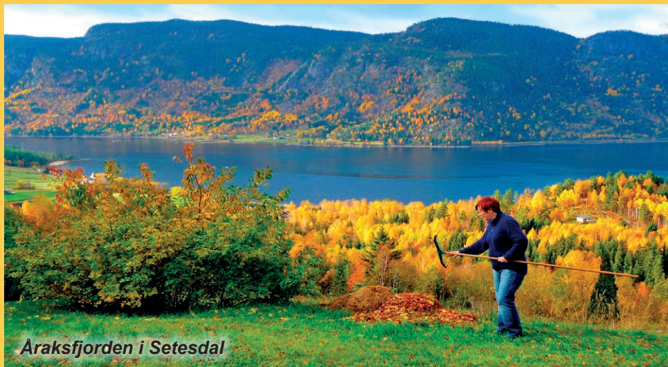
Araksfjorden i Setesdal