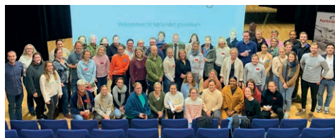
Fra ParkinsonNet-kurset på Nodeland i fjor.

"Å leve med parkinson", trinn 2-kurset, vil ikke bli arrangert denne høsten pga. manglende kapasitet i Arendal. Det har nemlig blitt holdt hele tre trinn 1-kurs hittil i år!