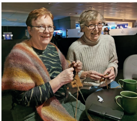
Hvis det en dag passer deg bedre, er det lov å bare strikke og være heia-gjeng...