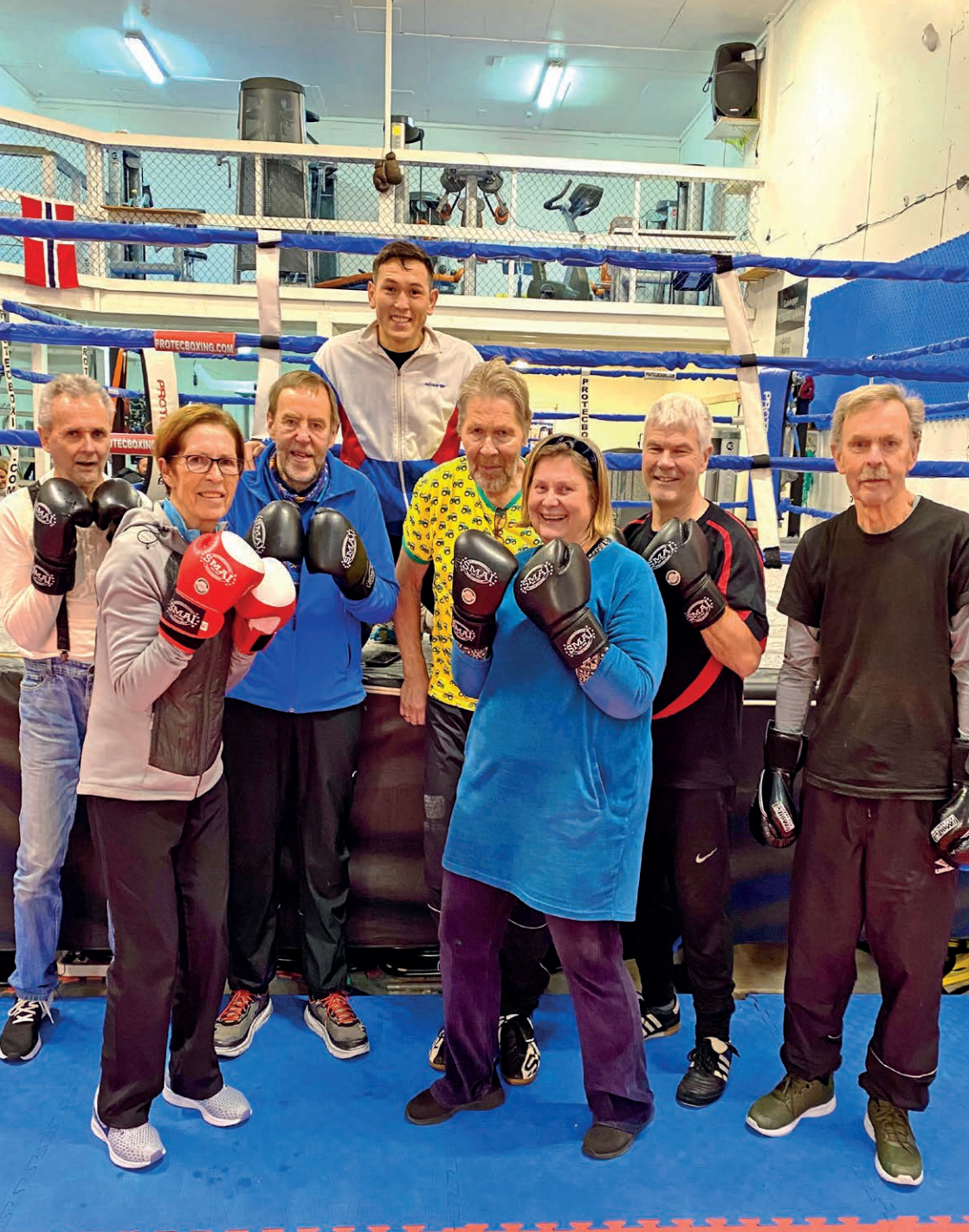
Boksejengen i Agder Øst parkinsonforening.