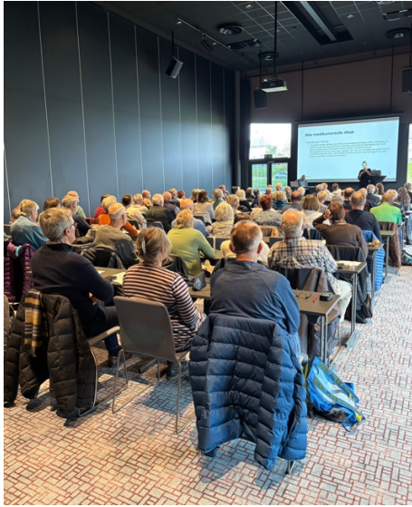
En lydhør forsamling (75 personer)