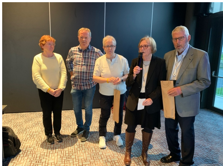
Arbeidsgjengen fra TROPF