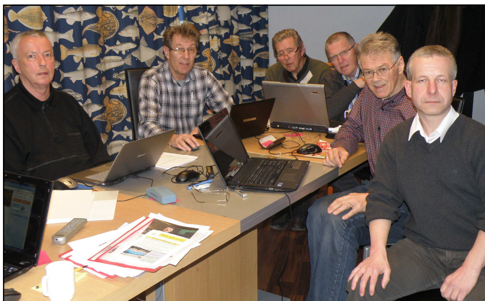
Medlemsblad for Møre og Romsdal Parkinsonforening