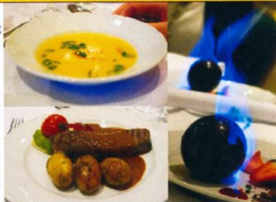
Meny: Hummersuppe, hjørtefilet, sjokoladeoverrasking

Ja eller nei til jubileumsfeiring? Det var ei av sakene til behandling då Møre og Romsdal Parkinsonforening hadde eksistert i ti år. Vedtaket vart eit prinsipielt ja, og det vart bestemt at fylkesfor-eininga skulle dekkje kostnadene for ein gjest frå forbundet. I år var det to gjester frå forbundet, kanskje fordi det var eit dobbeltjubileum: MRPF 30 år, Sunnmøre PF 25 år pluss 25. april 2015 vart det feira på Parken hotell i Ålesund.