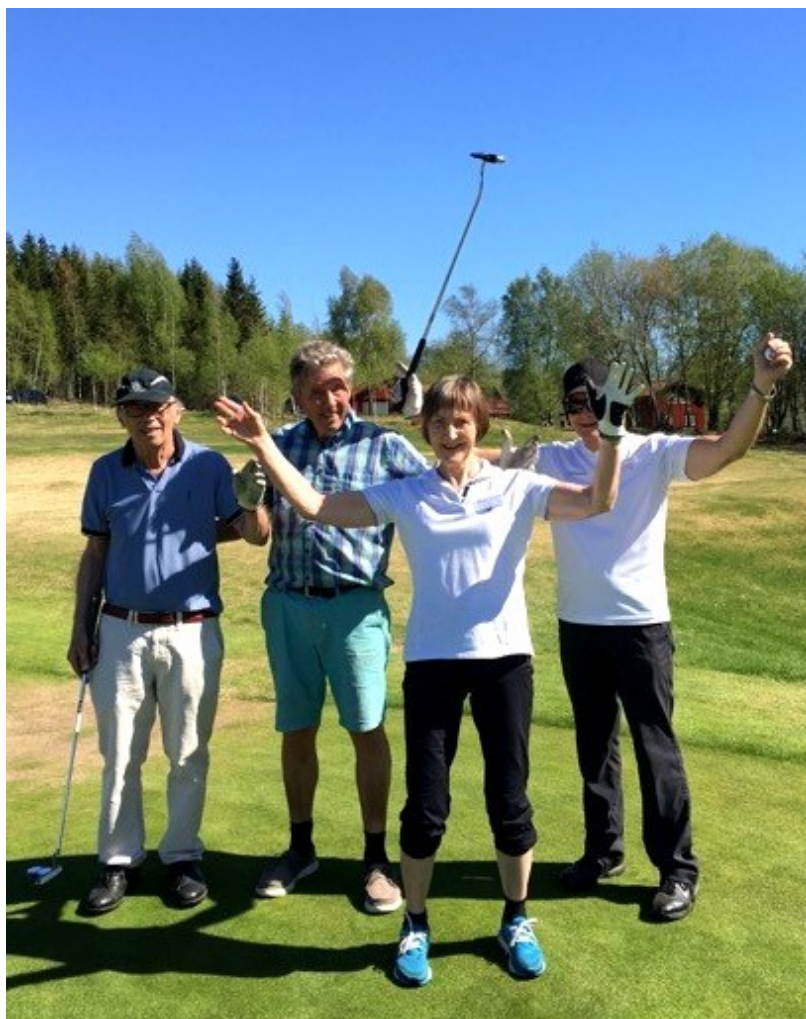
4 Medlemsblad for Møre og Romsdal Parkinsonforening

Nedenforstående bilde kan stå som et synlig bevis for den hygge og glede arrangementet gav oss som deltok. Når været er så bra, veiledningen så god og slaget ble så bra, er det ikke rart dette ble et vellykket opphold.