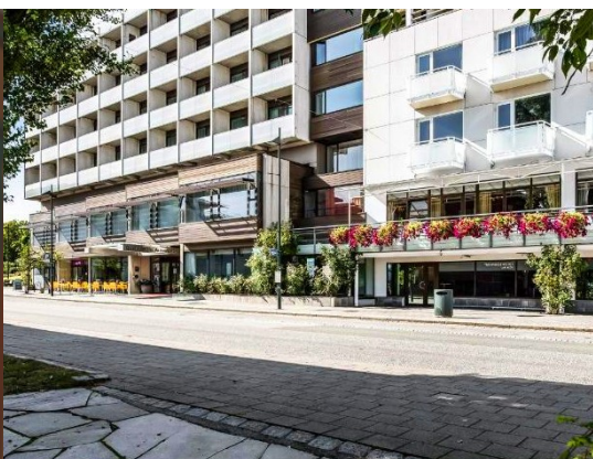
Scandic Alexandra Molde