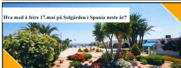
Hva med å feire 17.mai på Solgård i Spania neste år?

På vegne av alle som setter pris på vår artikkelserie Min Parkinson ber vi nettopp DEG om å dele din historie med bladets mange lesere, og gjerne om hvordan DU mestrer livet med parkinson i ryggsekken. Eller kanskje du er pårørende, så kan du skrive om Vår Parkinson! Adressen til redaksjonen finner du nederst på side 3 her i bladet.