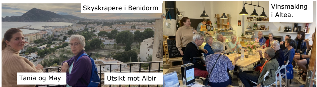
Skyskrapere i Benidorm