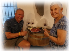
Vin- sma- king