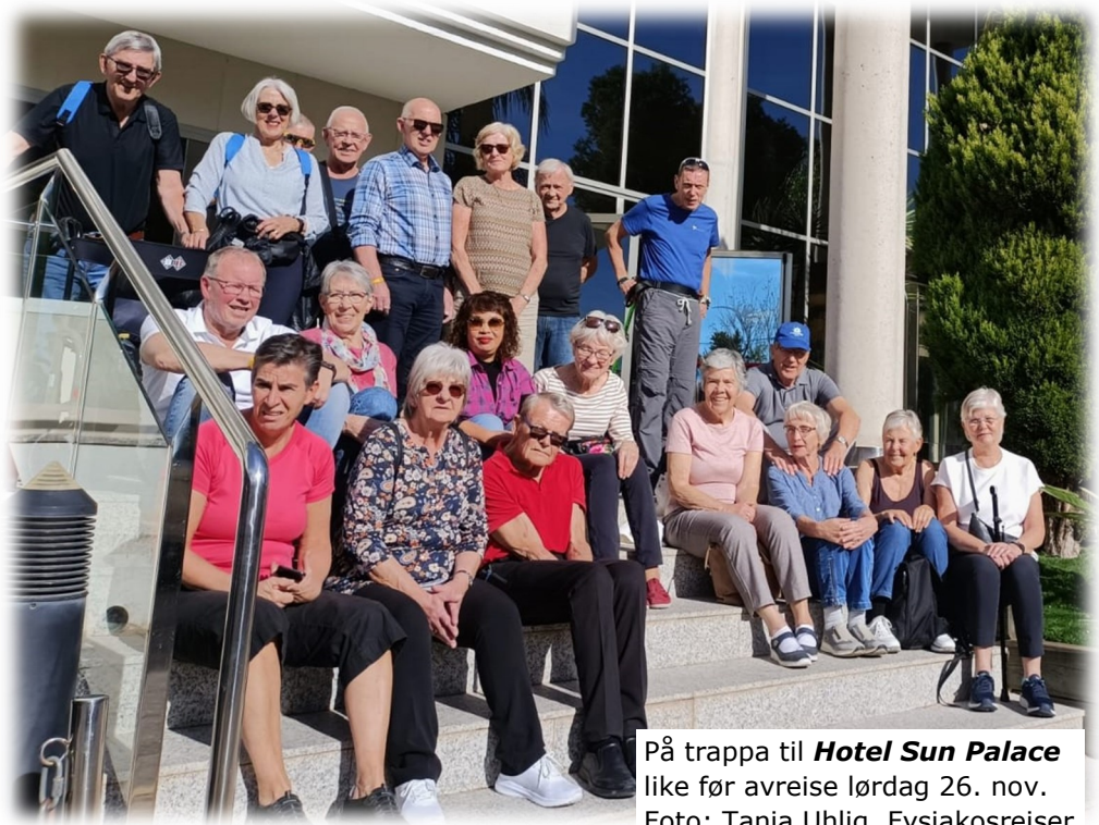
På trappa til Hotel Sun Palace like før avreise lørdag 26. nov.