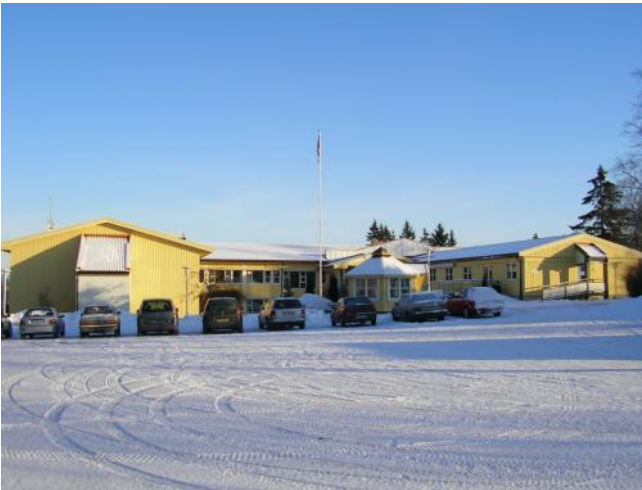
Kastvollen Rehabiliteringssenter i vinterdrakt

I samarbeid med bruker, tilrettelegges behandlingstilbud for å gi optimal utbytte av oppholdet.