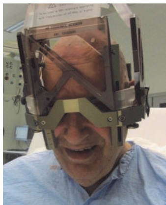
Klart for MR fotografering