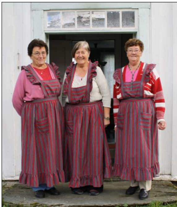
Trivelige vertskap: Disse fine damene serverte kaffe og viste oss rundt på Bygdetunet

Vi kjørte igjennom et frodig landskap med velstelte gårder. Ytterøy har et flateinnhold 28 kvadratkilometer og er 13,5 km lang og 4,3 bred. Det er i dag ca 50 gårdsbruk i drift der gårdsbebyggelse, dyrkamark, beitemark og skogsmark danner en mosaikk i landskapet. Ytterøya har en stor rådyrs-tamme og salg av jakt på