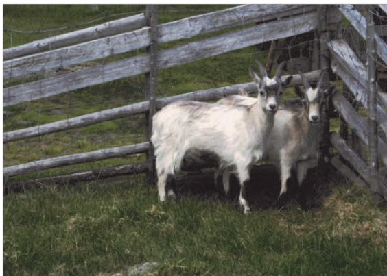
To geiter på Roknesvollen.

For de som skulle besøke Roknesvollen, en setervoll som er i drift om sommeren, var det oppmøte kl 13.00. For aktiviteter og grilling var tida satt til