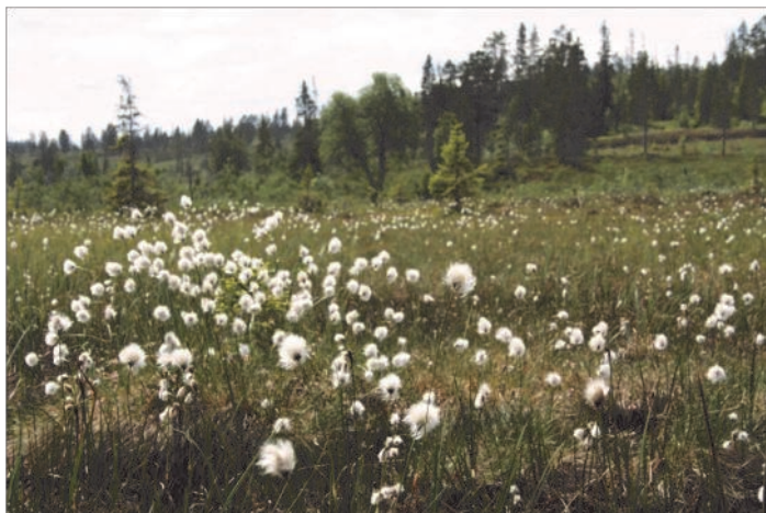
Herlig med myrer som denne ved Roknesvollen

kl 15.00. Det viste seg å være alt for kort tid. Distansen var lengre enn antatt slik at det ble for liten tid inne på vollen.