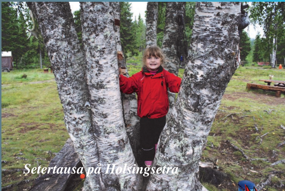
Setertausa på Holsingsetra

Nord-Trøndelag Parkinsonforening 1987—2012 25 år