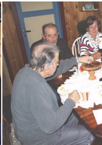
Seterkost: Senere på dagen uten konserveringsmiddel