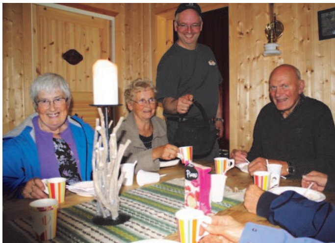
Svartkjel: Kaffen ble skjenket fra svartkjel som var varmet på åpent bål utenfor