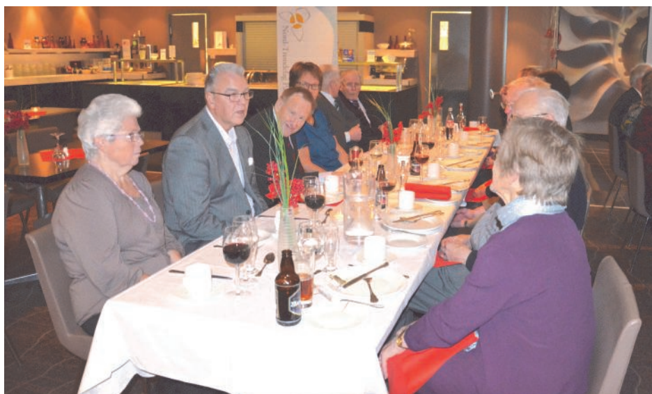
Fra jubileumsmiddagen, fotograf: Gerd Hovdahl.