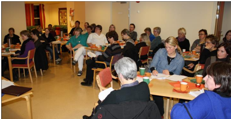
En lydhør forsamling. Kantina på sykeheimen var fylt til siste plass av pleiepersonell under temamøtet om Parkinsons sykdom på Høylandet.

og observere og notere når det skjer forandringer med pasienten. Ofte er det nødvendig med fysioterapi for å aktivisere pasienten. Han har lett for å ha smerter, spesielt rundt ledd på grunn av tilstiving og lite aktivitet.